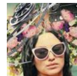
Sète en Live