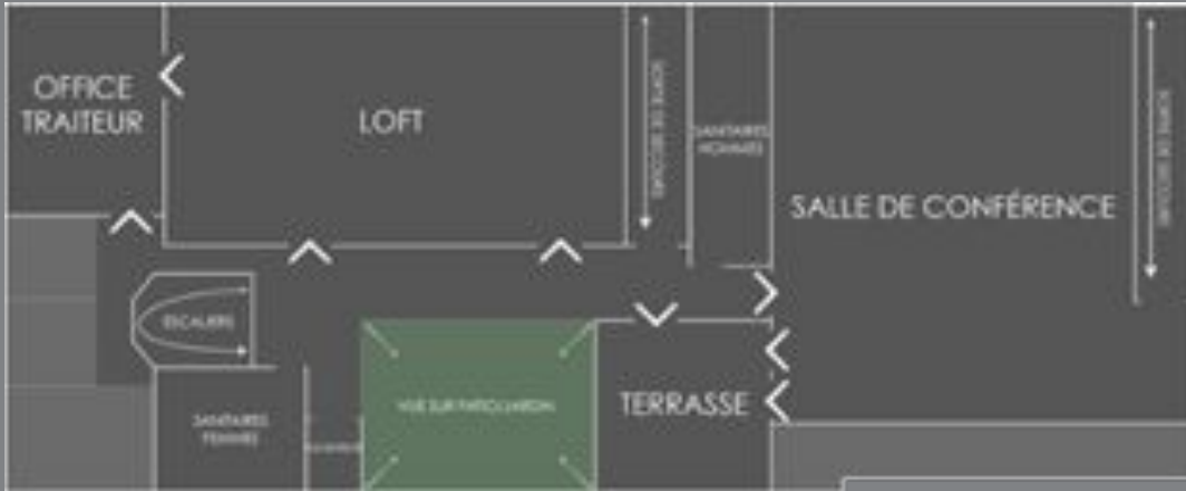
1 er étage